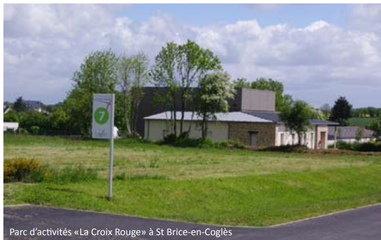
Parc d'activités «La Croix Rouge» à St Brice-en-Coglès

La ZA «La Croix Rouge» labellisée Qualiparc par la Région Bretagne, offre un cadre exceptionnel